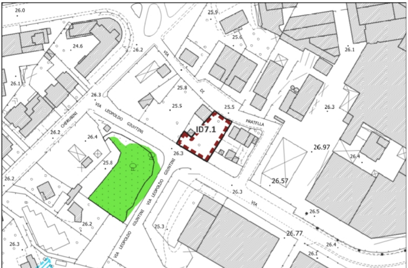
Inquadramento vincoli sovraordinati – Scala 1:2.000