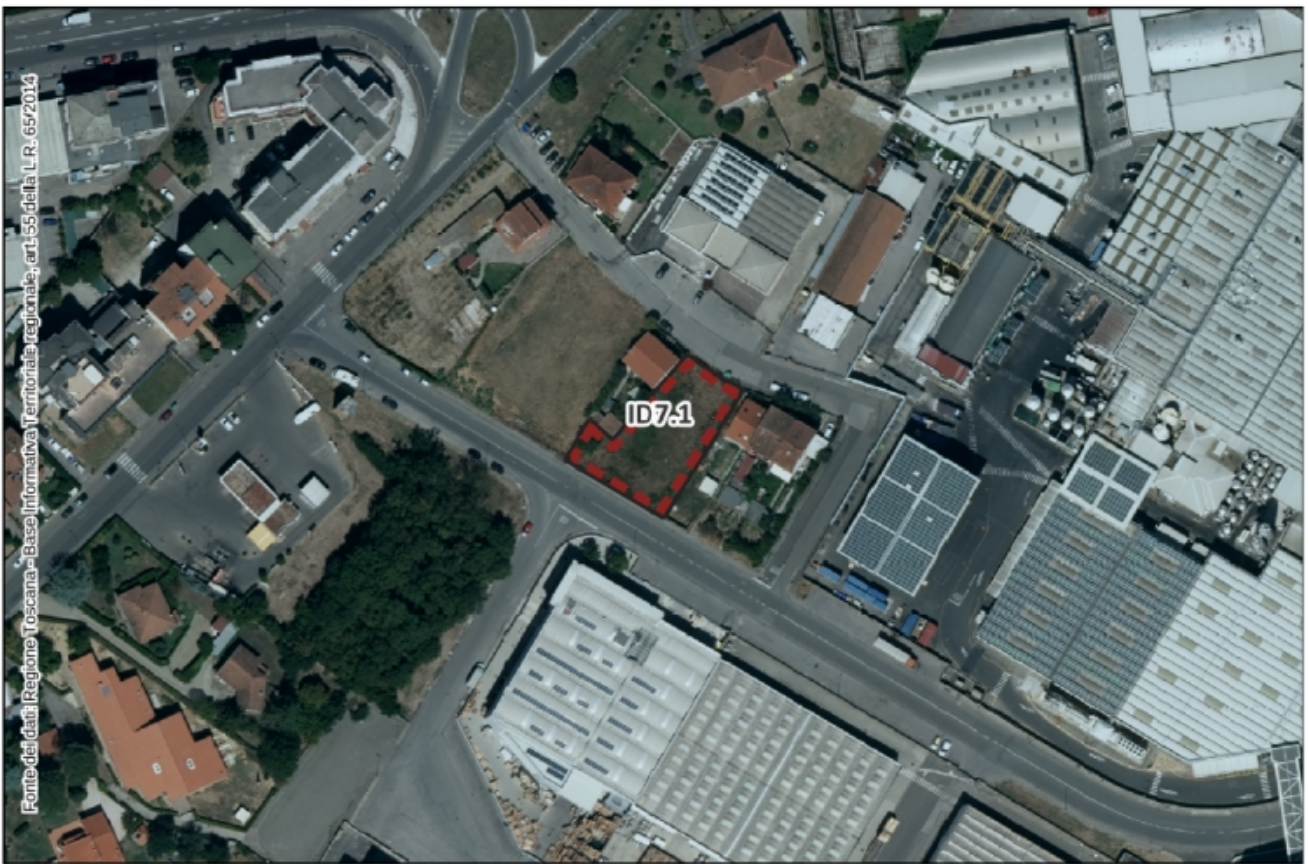
Inquadramento Ortofoto 2021 – Scala 1:2.000