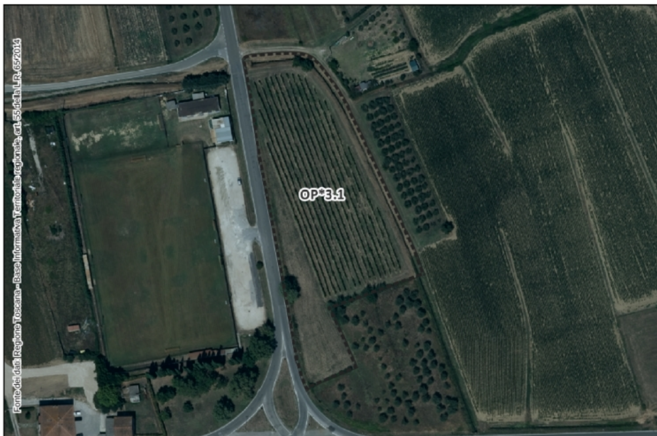
Inquadramento Ortofoto 2021 – Scala 1:2.000