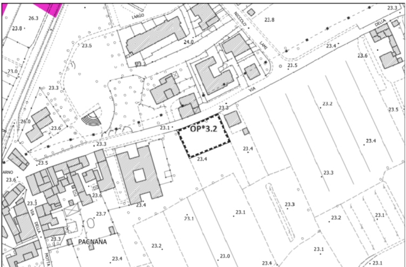
Inquadramento vincoli sovraordinati – Scala 1:2.000