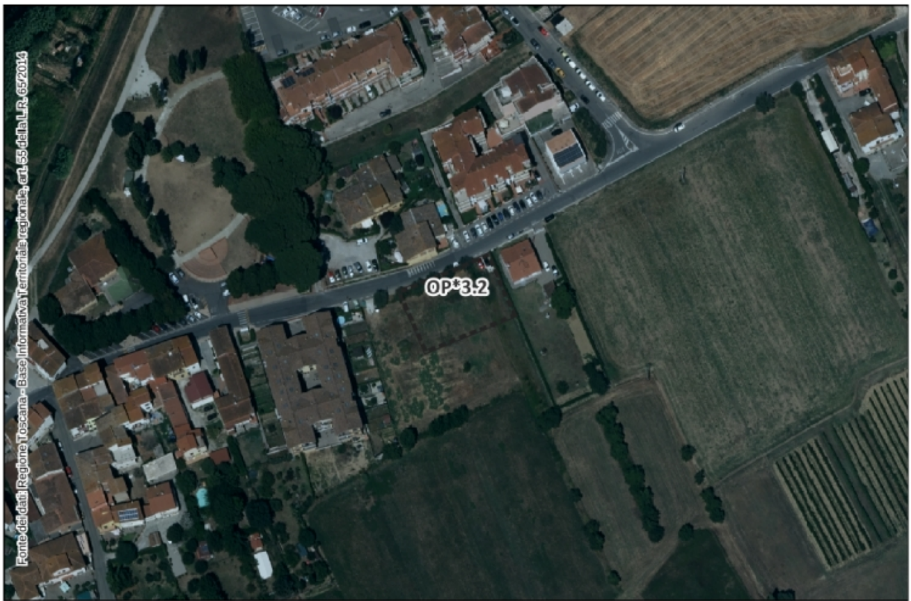
Inquadramento Ortofoto 2021 – Scala 1:2.000