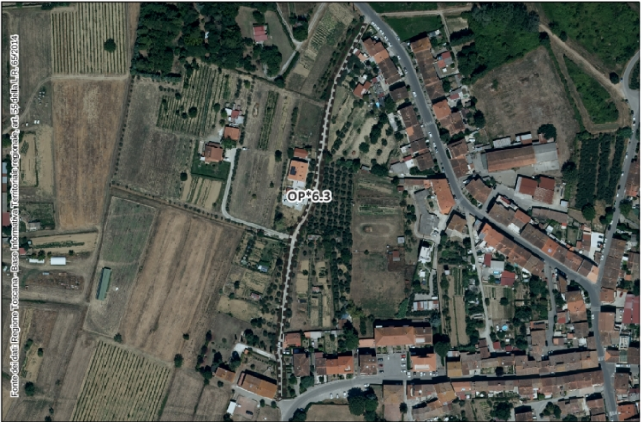
Inquadramento Ortofoto 2021 – Scala 1:3.000