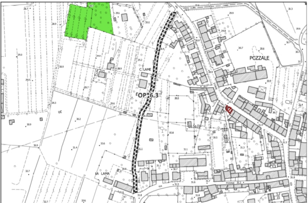
Inquadramento vincoli sovraordinati – Scala 1:3.000