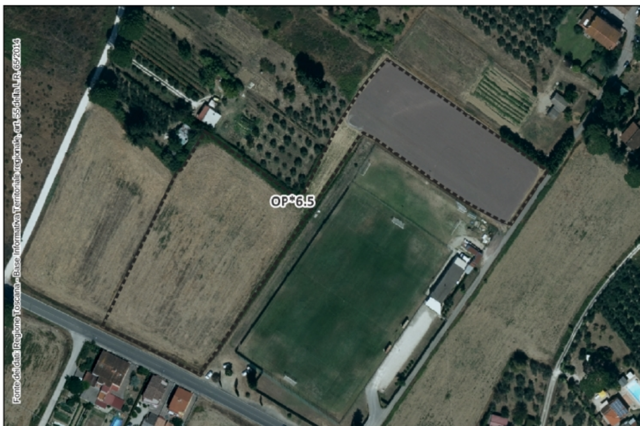
Inquadramento Ortofoto 2021 – Scala 1:3.000