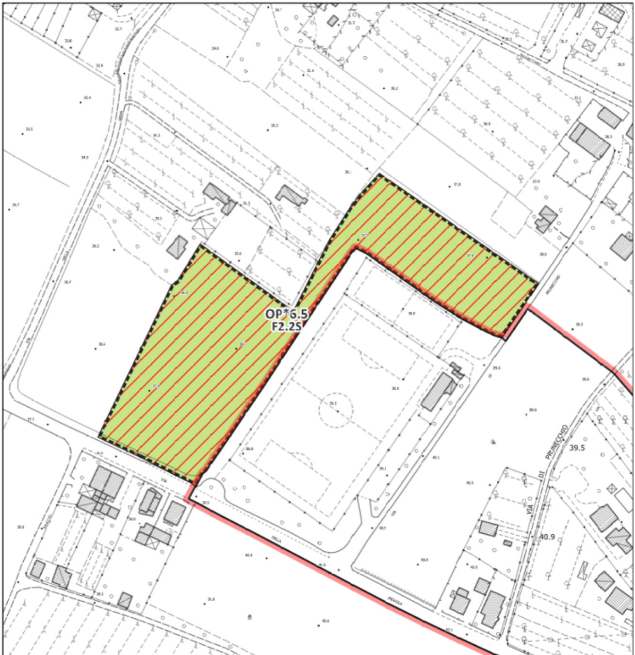
Inquadramento dell'area di intervento – Scala 1:2.000

U.T.O.E. n. 3 EM – Tav. n. 2.1, 2.2 – Disciplina del territorio rurale / Tav. n.3.6 – Disciplina del territorio urbano