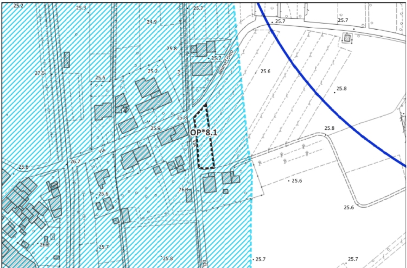
Inquadramento vincoli sovraordinati – Scala 1:2.000