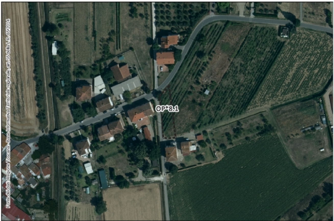
Inquadramento Ortofoto 2021 – Scala 1:2.000