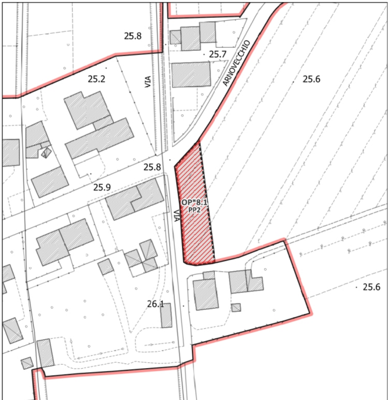
Inquadramento dell’area di intervento – Scala 1:1.000

U.T.O.E. n. 8 EM – Tav. n. 2.1 – Disciplina del territorio rurale / Tav. n.3.5 – Disciplina del territorio urbano