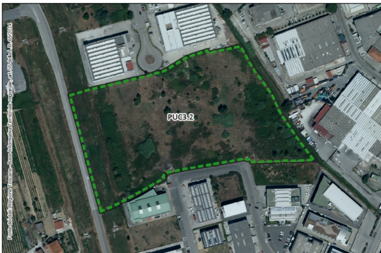
Inquadramento Ortofoto 2021 – Scala 1:3.000