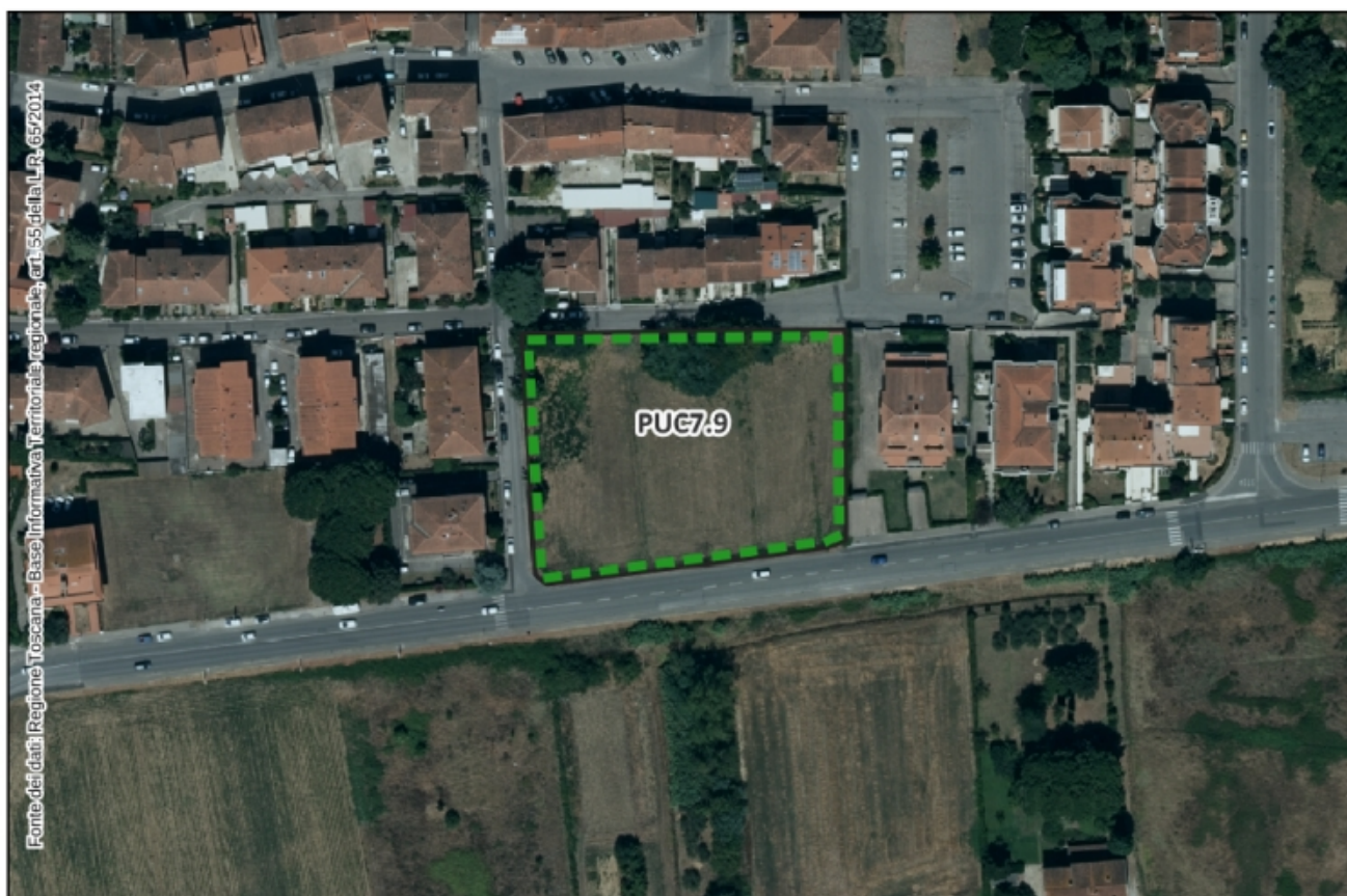
Inquadramento Ortofoto 2021 – Scala 1:2.000